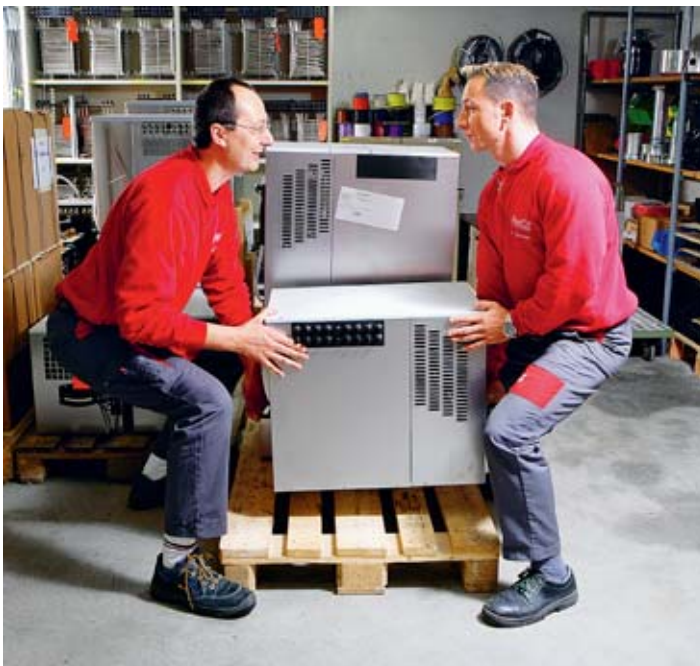
Bild 15 Zu zweit geht's besser.

Bild 16 Auf langen Transportwegen können scheinbar leichte Gewichte ganz schön schwer werden! Deshalb sind bei langen Wegen immer Abstriche beim Gewicht zu machen. Muss man beispielsweise eine Last 20 m weit tragen, nimmt man nur noch die Hälfte dessen, was man sich sonst auf einer Kurzdistanz von 2 m zugemutet hätte. Lässt sich die Last nicht teilen, so sollten Sie ein Transporthilfsmittel benutzen.