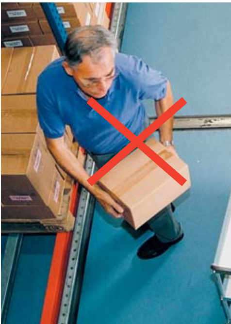
Bild 10 Beim Anheben und Abstellen der Last ist unbedingt das gefährliche Verdrehen des Oberkörpers zu vermeiden.