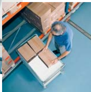
Bild 11 Machen Sie beim Umladen von Lasten von einer Seite auf die andere immer einen Zwischenschritt.