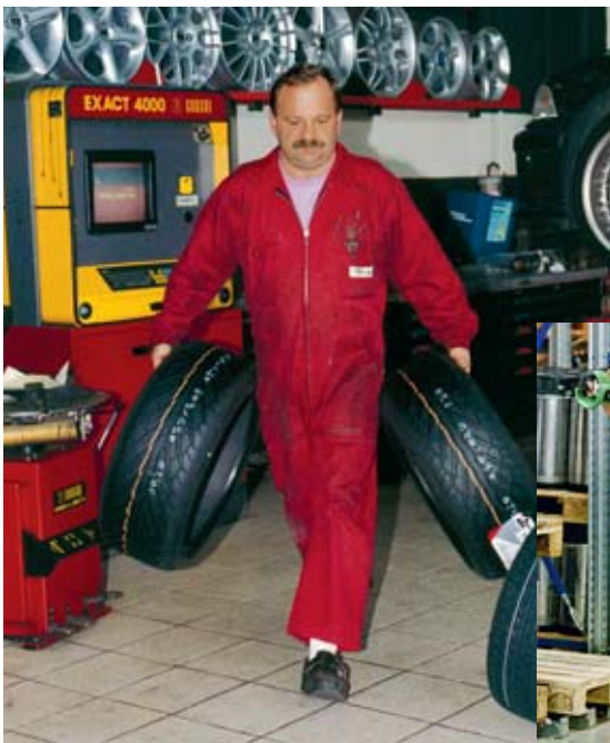
Bild 7 Last wenn immer möglich gleichmässig verteilen.

Auch für das Absetzen von Lasten gilt: In die Knie gehen und Rücken gerade halten!