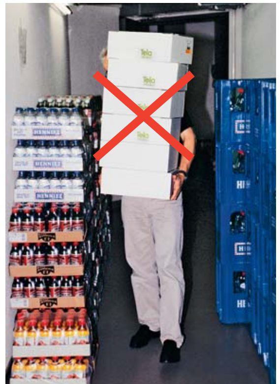
Bild 12 Oft werden Pakete aufeinander gestapelt und versperren die Sicht. Wenn es dann im «Blindflug» noch Treppen rauf und runter geht, wird's gefährlich. Also: Auf gute Sicht achten!