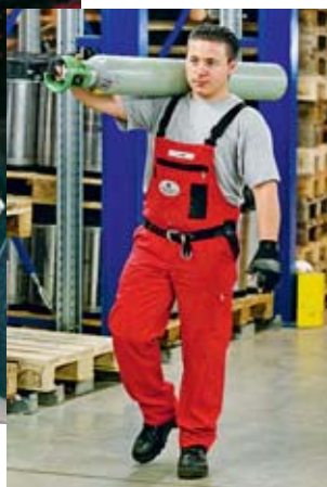
Bild 8 Säcke und Stahlflaschen werden am besten auf den Schultern getragen – mit gestrecktem Rücken!

Praktische Anleitungen zum richtigen Heben und Tragen werden von den Rückenschulen der Schweizerischen Rheumaliga und von spezialisierten Physiotherapeuten und -therapeutinnen angeboten.