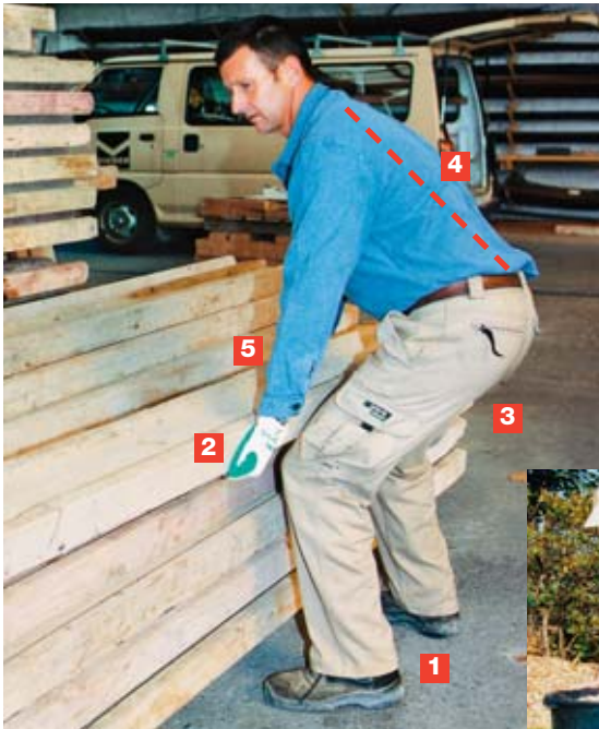
Bild 5 Richtig heben. Das gilt am Arbeitsplatz ...